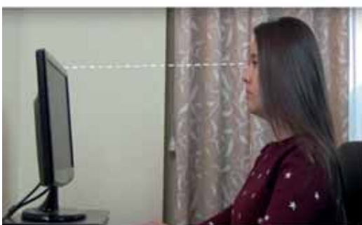
Coloca la pantalla frente a ti, a unos 40-50 cm aproximadamente.