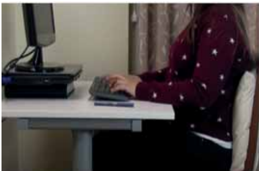
Guarda una distancia mínima desde el teclado al borde de la mesa.